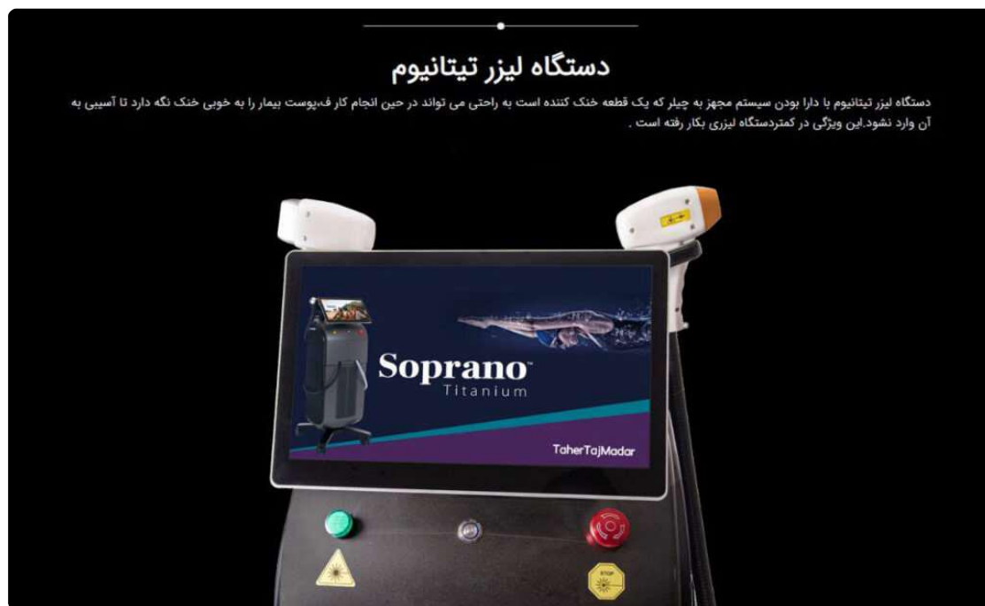
قیمت دستگاه لیزر تیتانیوم

فرد داوطلب در این لحظه احساس گرمای اندکی را روی پوست خود تجربه می‌کند اما در مقابل ژل قرار گرفته از افزایش نگرانی برای آسیب رسیدن به پوست جلوگیری خواهد کرد. بسته به محل استفاده از دستگاه لیزر Soprano Titanium، ممکن است پوست بعضاً به رنگ قرمز متمایل شود. با این حال موضوع اشاره شده ارتباط مستقیمی با شرایط پوستی استفاده کننده و البته منطقه‌ای از پوست که مورد درمان قرار می‌گیرد، دارد. استفاده از این دستگاه برای هر جلسه زمانی در حدود ۱۰ دقیقه را به خود اختصاص می‌دهد. گرمای احساس شده توسط مخاطب چیزی شبیه به ماساژ با سنگ داغ است و ممکن است در مواردی اندک و البته نقاط حساس پوست با درد اندکی همراه شود.