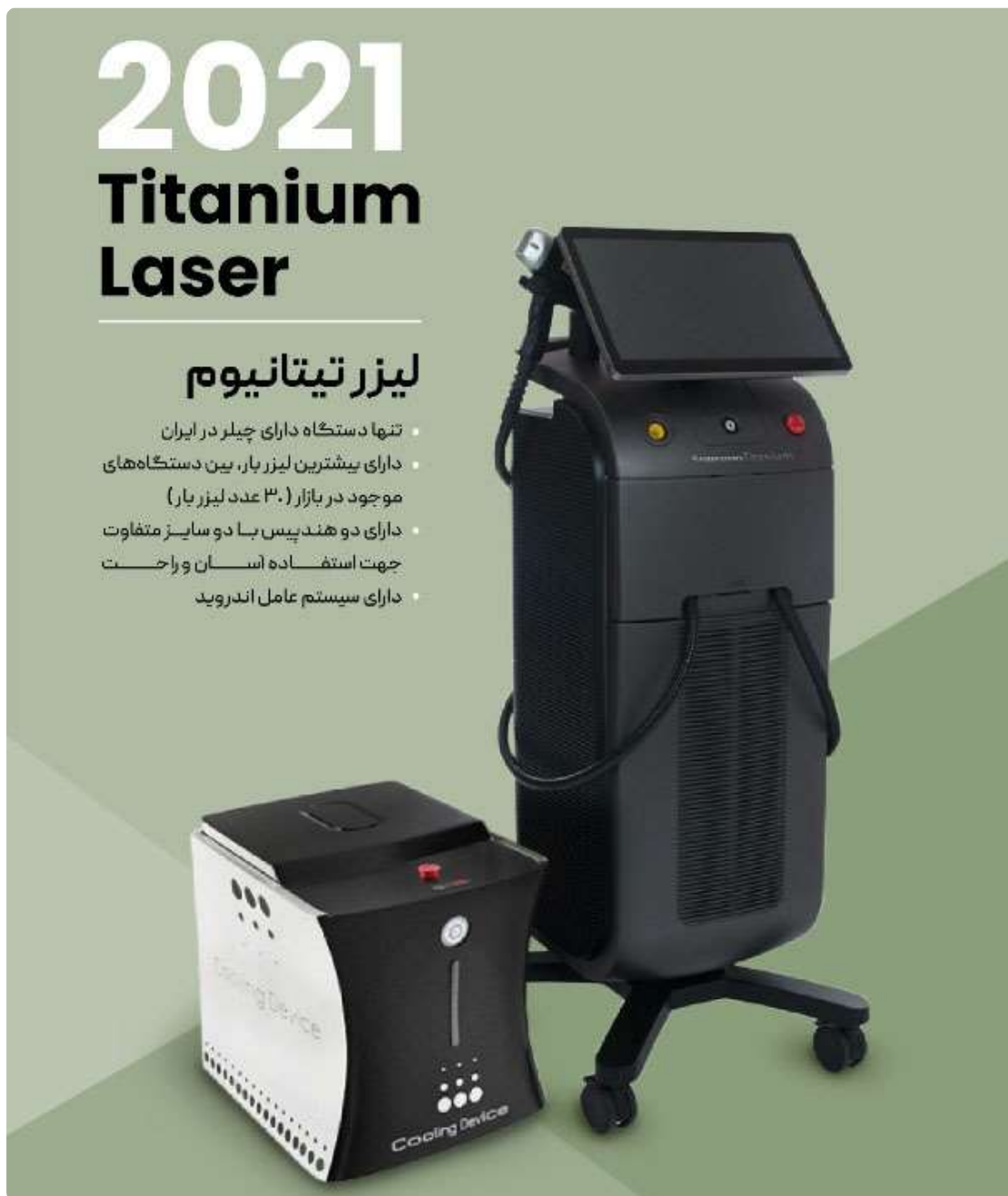
خرید دستگاه لیزر تیتانیوم

شاید برای بسیاری که از وجود موهای زائد روی بدن خود رضایت ندارند، استفاده و خرید دستگاه لیزر تیتانیوم ۲۰۲۱ Soprano Titanium کاری دور از دسترس، سخت و پرهزینه باشد اما واقعیت ماجرا چیز دیگری است. سال‌هاست که از بین بردن موهای زائد بدن مورد توجه انسان‌ها قرار گرفته و روش‌های متعددی برای انجام این کار وجود دارد اما پیشرفت علم و تکنولوژی گزینه استفاده از لیزر را تبدیل به بهترین روش ممکن کرده است. روشی که بسیاری از ضعف‌های رویکردهای سنتی در آن حذف شده و البته با بهره‌گیری از ماندگاری طولانی می‌تواند در دسرهای باقی ننگه داشتن وضعیت بهبود یافته را تا حد زیادی کاهش دهد.